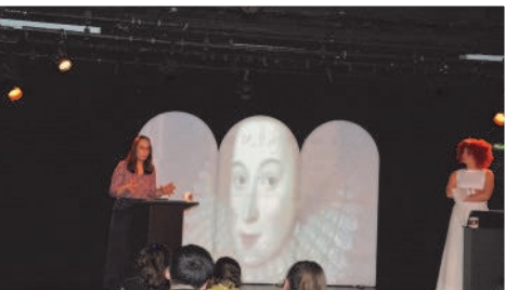
Un spectacle de l'UPEC sur la paternité ou plutôt maternité de l'œuvre de William Shakespeare