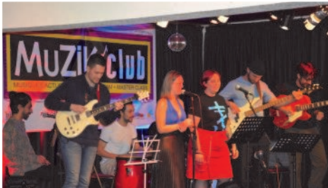
Les élèves du conservatoire de Limeil-Brévannes