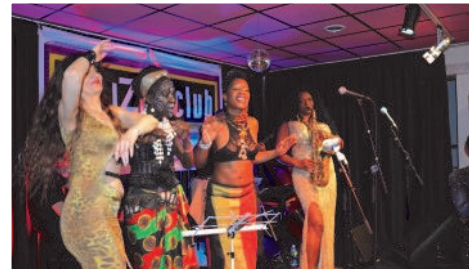
Un concert animé aussi par des danseuses