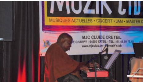
Un invité de marque : Cheick Tidiane Seck